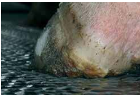
■ Comfortabel en goede grip