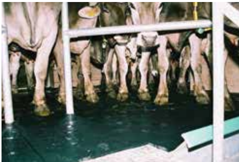
■ Op dichte vloeren en in melkstal